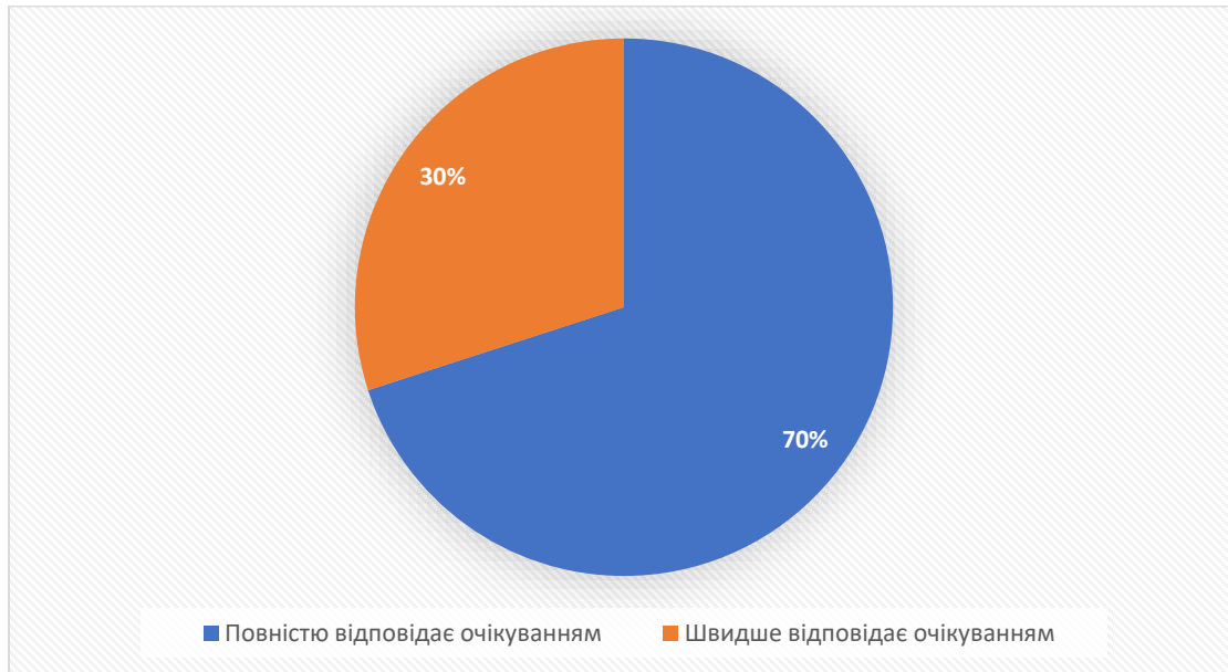
Рис. 6 Очікувана якість підготовки фахівців щодо формування необхідних компетентностей

На думку експертів освітня програма цілком забезпечує формування тих компетентностей, які потрібні фахівцям для ефективної роботи в установі/організації . Якість підготовки фахівців відповідає очікуванням.