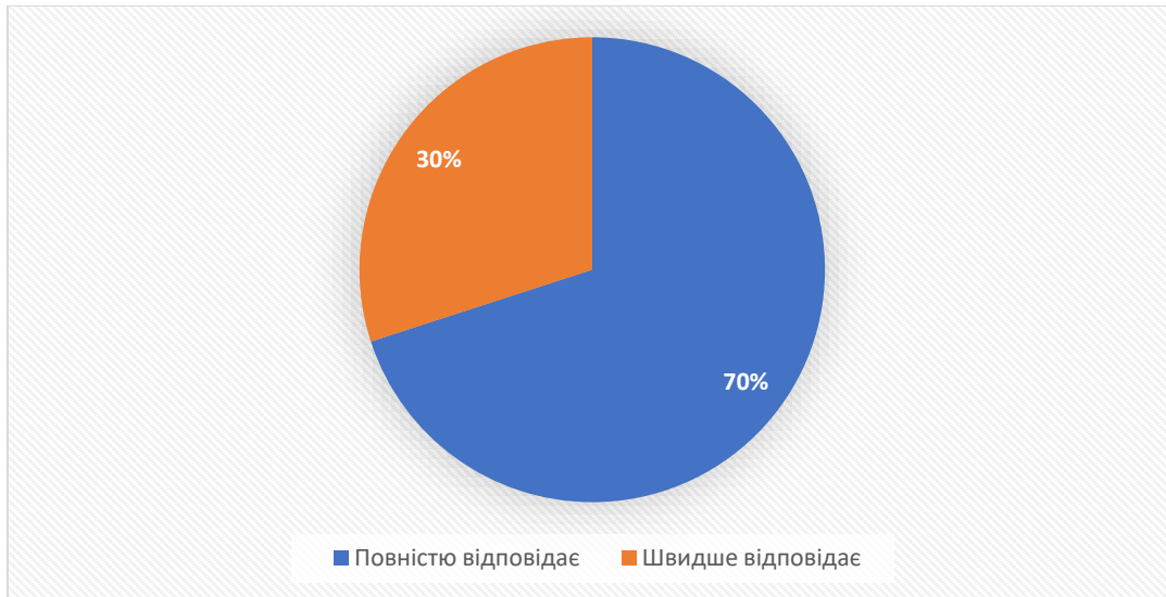
Рис. 2 Очікування роботодавців до кваліфікації студентів/випускників

Рекомендовані фахові компетентності, які, на думку експертів, необхідно додати до опанування здобувачами вищої освіти спеціальності «Хореографія»: