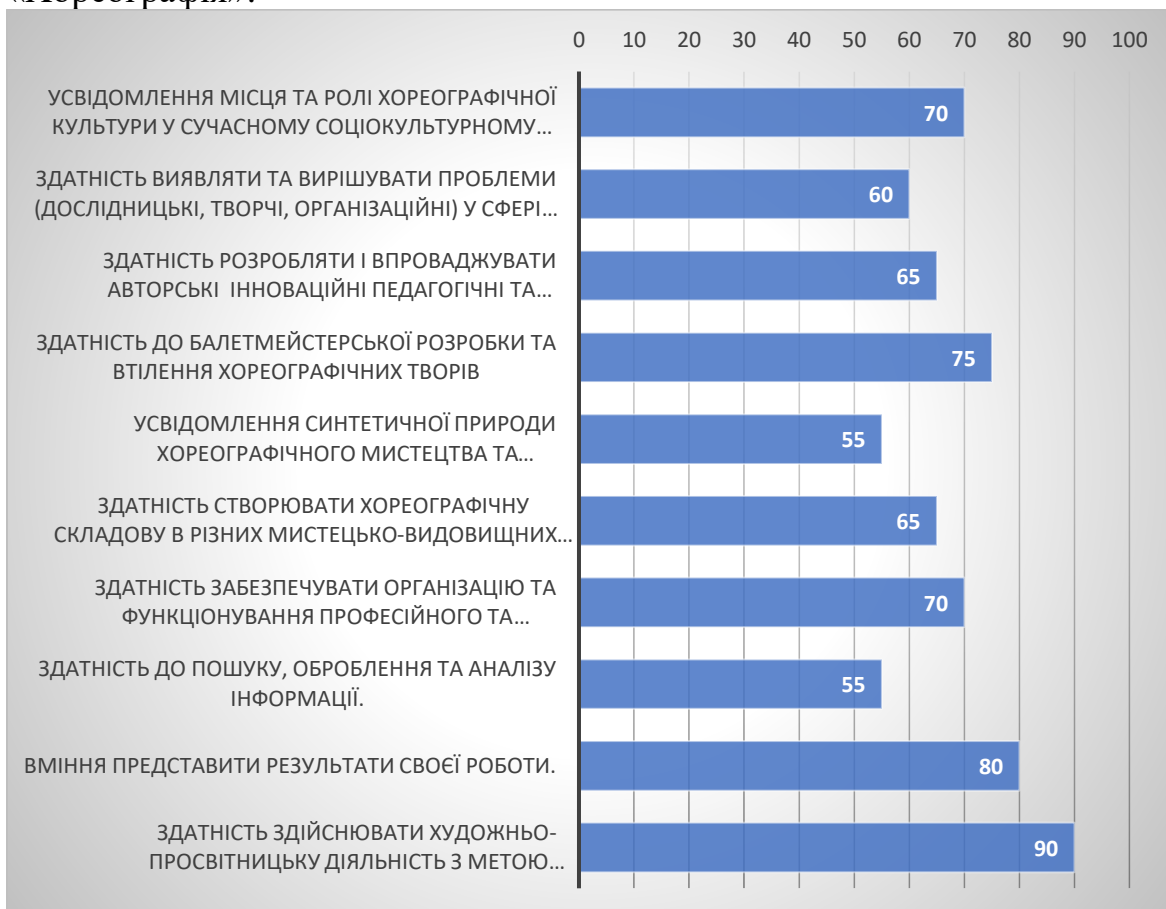
Рис. 3 Рекомендовані стейкхолдерами додаткові фахові компетенції

Рекомендовані фахові компетентності, які, на думку експертів, необхідно додати до опанування здобувачами вищої освіти спеціальності «Хореографія»: